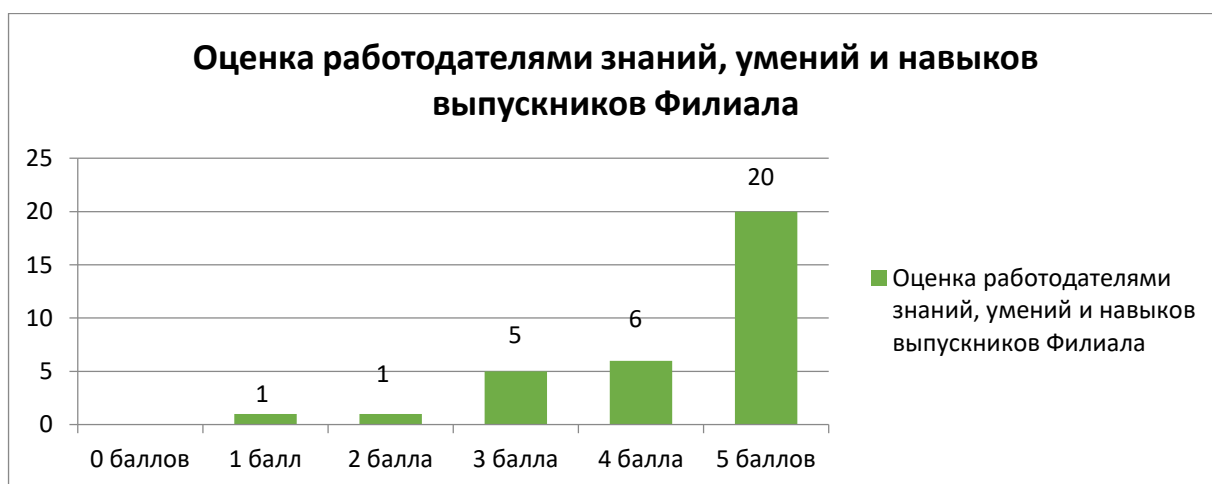
Рисунок 5. Оценка работодателями по пятибалльной шкале уровня практических умений и навыков выпускников Филиала, где 1 балл – низкий уровень, 5 баллов – высокий уровень

Участникам анкетирования было предложено по пятибалльной шкале оценить уровень теоретической подготовки выпускников Филиала. Результаты опроса представлены на рисунке 4. 15 опрошенных оценили теоретическую подготовку выпускников на уровне 5 баллов, 9 опрошенных дали оценку 4 балла.