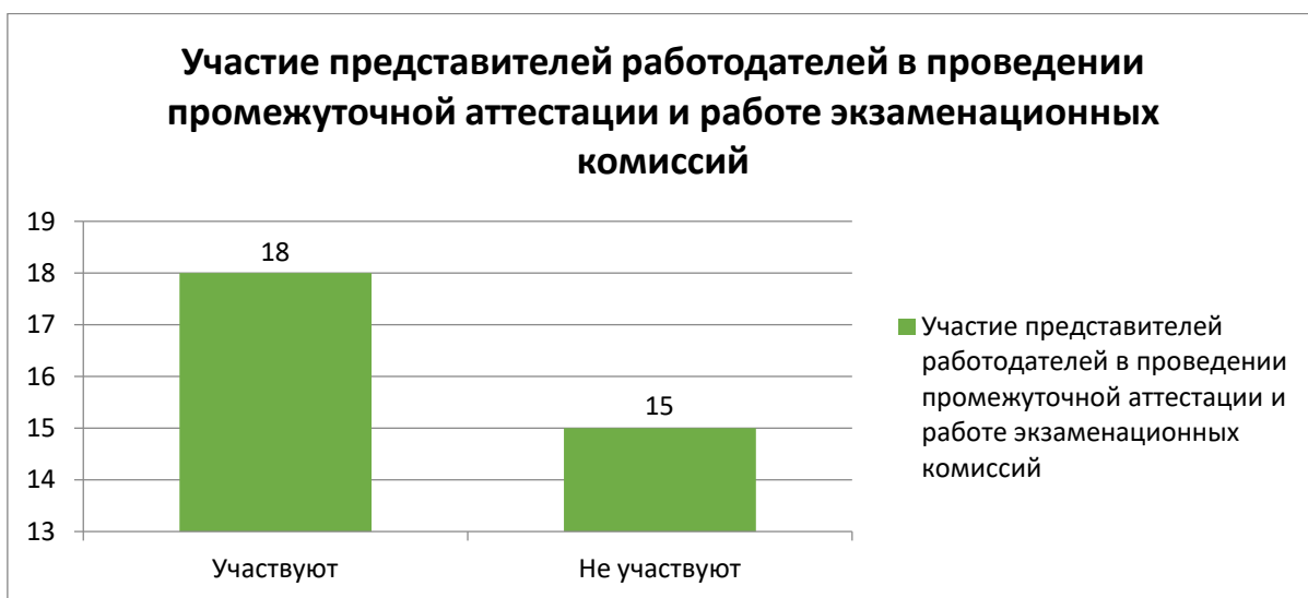
Рисунок 2. Участие представителей работодателей в проведении промежуточной аттестации и работе экзаменационных комиссий по проведению квалификационных экзаменов

Респондентам был задан вопрос: «Участвуют ли представители вашей организации в проведении государственной итоговой аттестации выпускников Филиала и в работе государственных экзаменационных комиссий?».