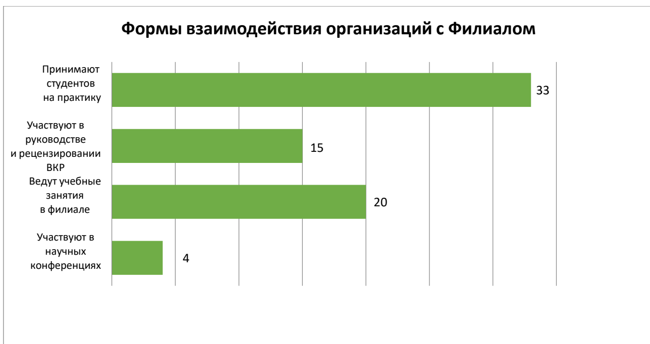
Рисунок 3. Формы взаимодействия организаций работодателей с Филиалом

К работе экзаменационных комиссий по проведению квалификационных экзаменов привлекаются 18 представителей работодателей, согласно ответам респондентов. На рисунке 2 показано, что 15 респондентов отметили, что их организации не принимают участие в оценке знаний обучающихся в филиале в рамках промежуточной аттестации.