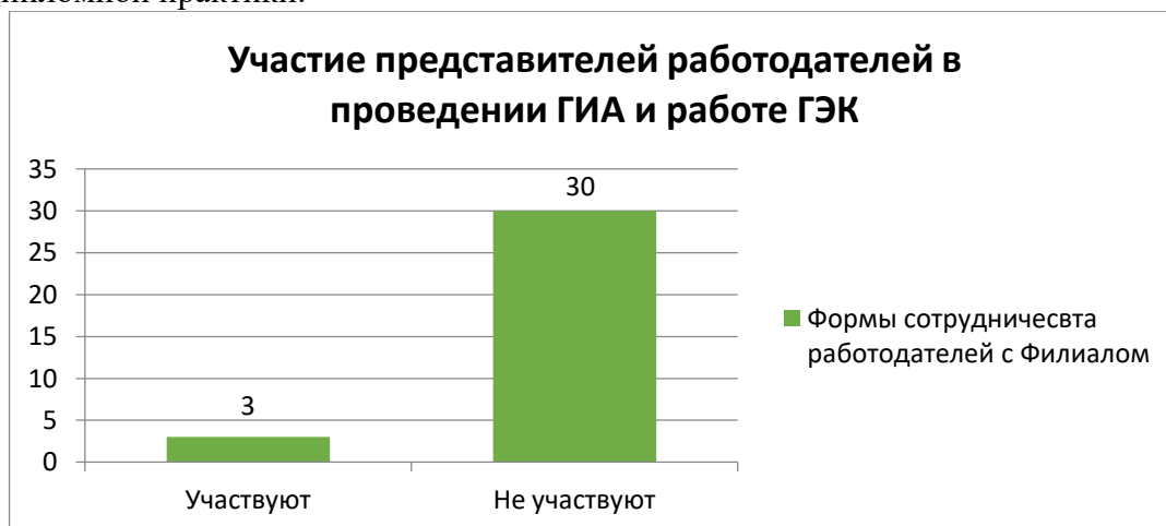
Рисунок 1. Участие представителей работодателей в проведении государственной итоговой аттестации выпускников Филиала и работе государственных экзаменационных комиссий

В настоящий момент в Иркутском филиале ВГИК заключено 97 договоров с организациями и предприятиями, в том числе с 33 организациями аудиовизуальной сферы. В 2022 году заключено 17 договоров на прохождение производственной и преддипломной практики.